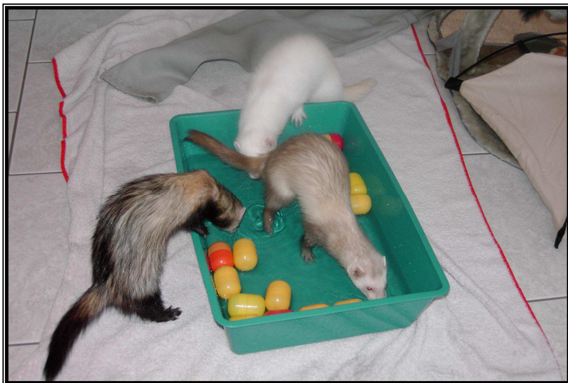
Une petite piscine d'eau, rien de tel pour les rafraichir, mais UNIQUEMENT SOUS SURVEILLANCE !!!!

Vous pouvez également disposer d'une petite piscine afin que votre animal s'y rafraîchisse de lui-même.